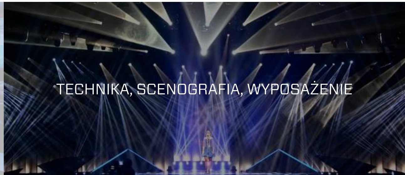
TECHNIKA, SCENOGRAFIA, WYPOSAŻENIE